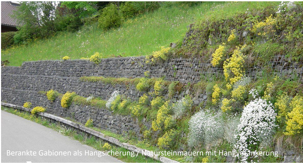
Berankte Gabionen als Hangsicherung / Natursteinmauern mit Hangverankerung