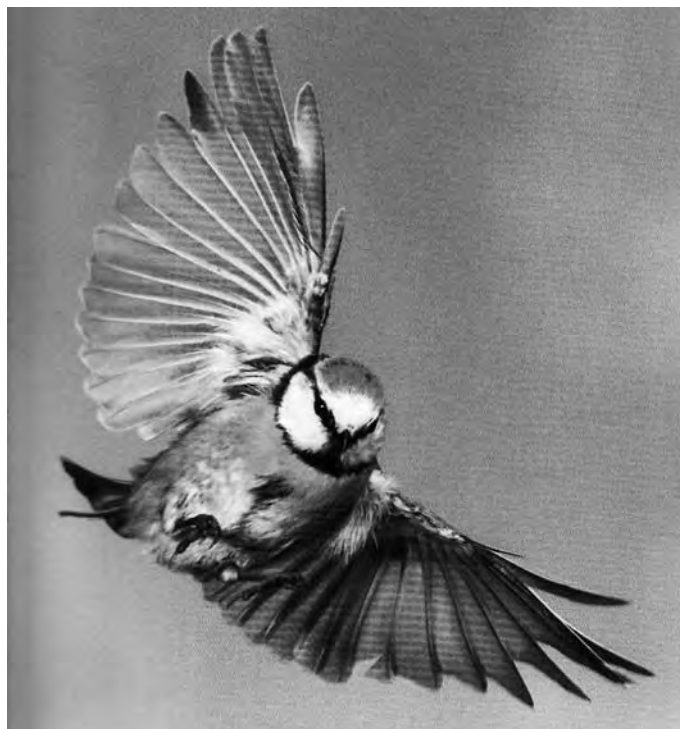
Das Bild zeigt eine Blaumeise im Anflug und ist dem Buch „Vögel rund ums Haus“ von Wolfgang Dreyer entnommen.

Als Quelle für die Darlegungen diene vorwiegend das Internet.