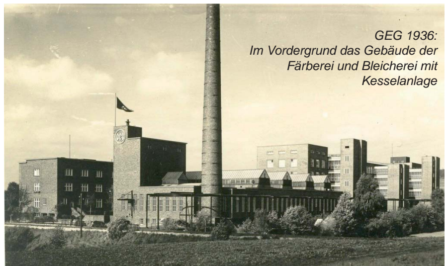
GEG 1936: Im Vordergrund das Gebäude der Färberei und Bleicherei mit Kesselanlage

1938 verkaufte die GEG das Werk an Siemens-Schuckert, die nachfolgenden Geschehnisse gehören nicht mehr zum Thema Textilindustrie. Immerhin arbeiteten 1986 in den Gebäuden der früheren GEG 1.800 Beschäftigte (Schaltelektronik Oppach).